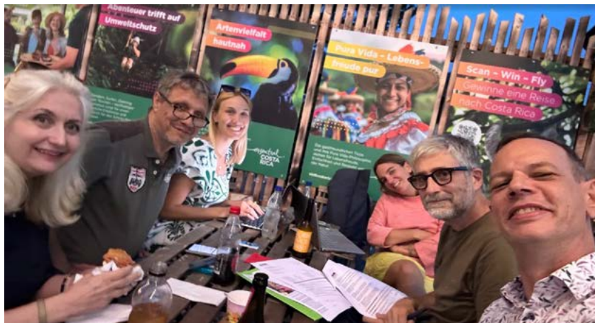
Das OBR-Team an der Sitzung an den Strandfestwochen