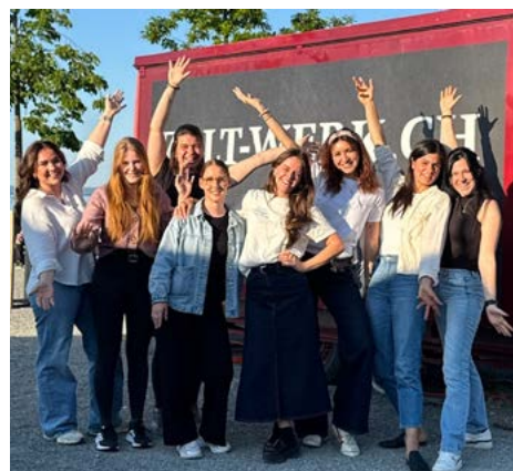
Die Zelt-Werk Crew ist dieses Jahr unser Gast